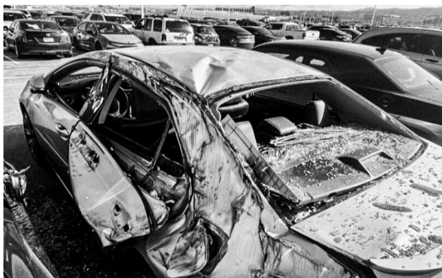
ガラスが粉々に砕けました(写真)。

2024年3月8日、アメリカ・サンフランシスコ国際空港から関西空港に向かうユナイテッド航空の旅客機(B777型機)が滑走路を離陸した直後(離陸5~6秒後)に、タイヤが外れ駐車場の車を直撃し、激しく損傷し窓